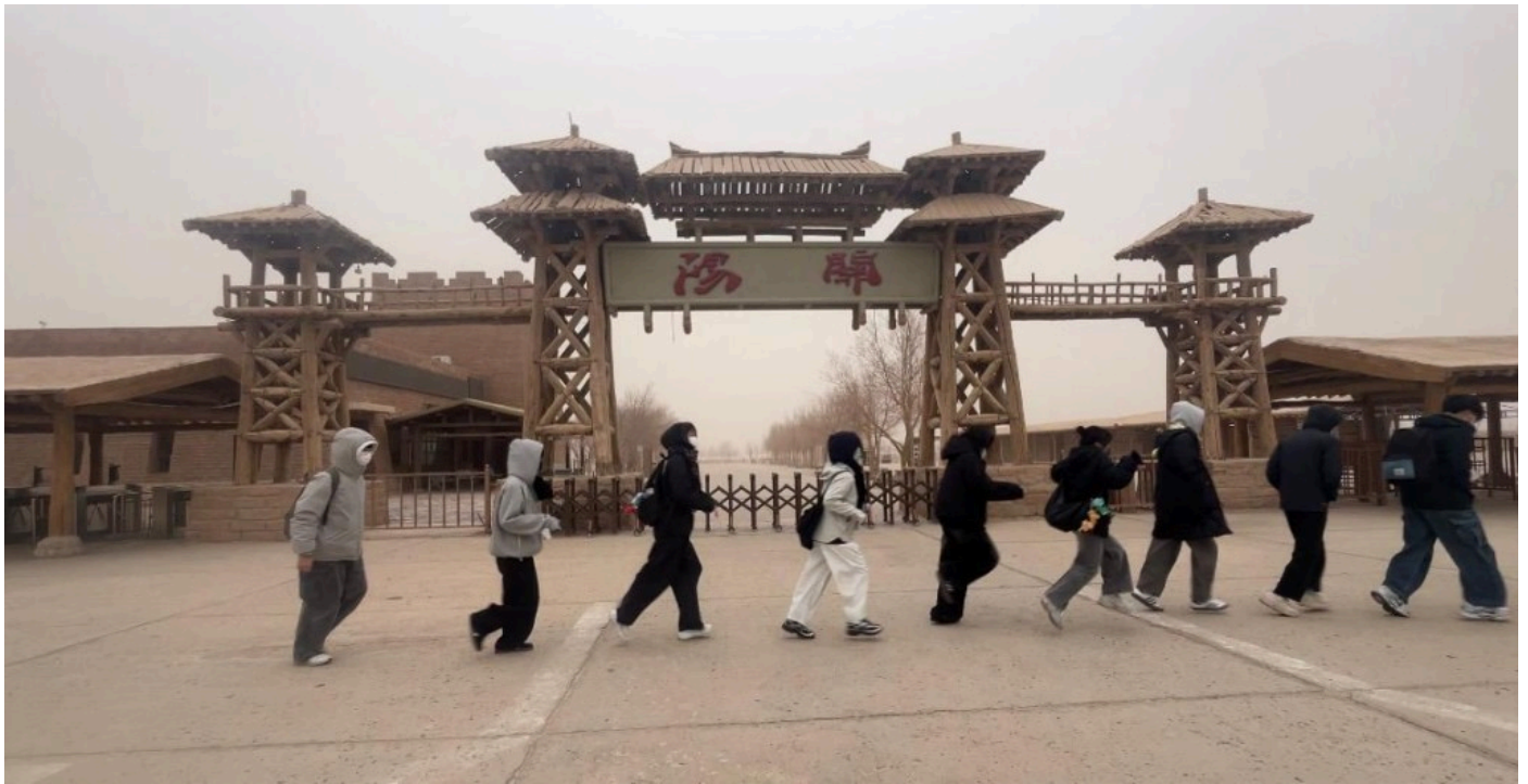
親身感受陽關大漠，蒼涼雄渾的邊塞氣韻。

抵達陽關那日，氣溫驟降至攝氏零度，刺骨的寒風挾著沙粒掠過荒原，令在南方長大的我與同行同學們無不瑟瑟發抖。在那片一望無際的荒漠上，黃沙漫捲如濤，枯草斜伏，我們頂著風沙緩步前行，卻在窺見那座傳說中邊塞重鎮的廬山真面目時寒意漸消。那一刻，課本中「金戈鐵馬、氣吞萬裡如虎」的邊塞場景，不再是乏味的文字記憶，而是在漫天塵煙中變得清晰可觸，古人戍邊的堅守與豪情，也在寒風中悄然湧上心頭。