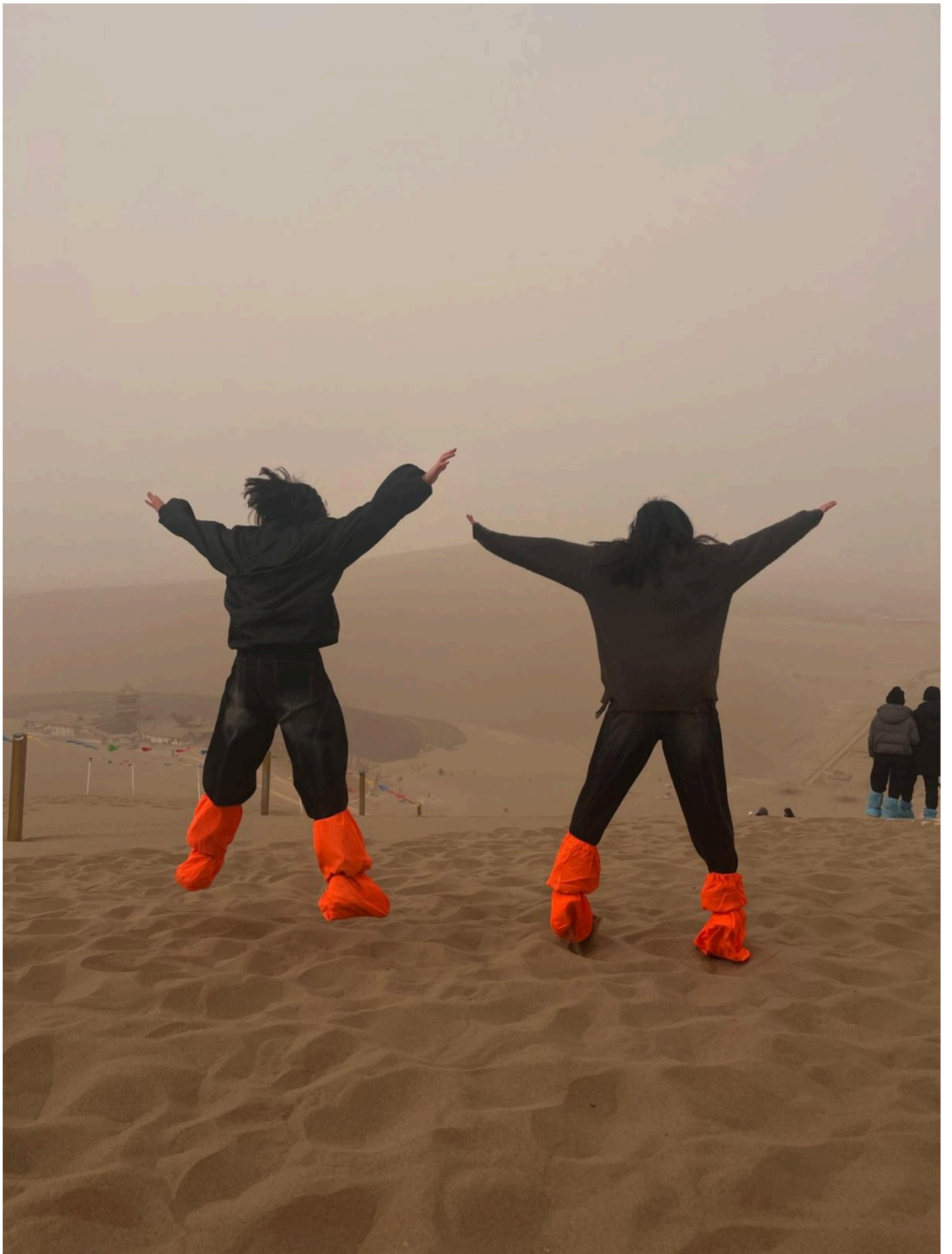
與好友相伴沙漠，克服內心恐懼，定格歡快飛躍時刻。