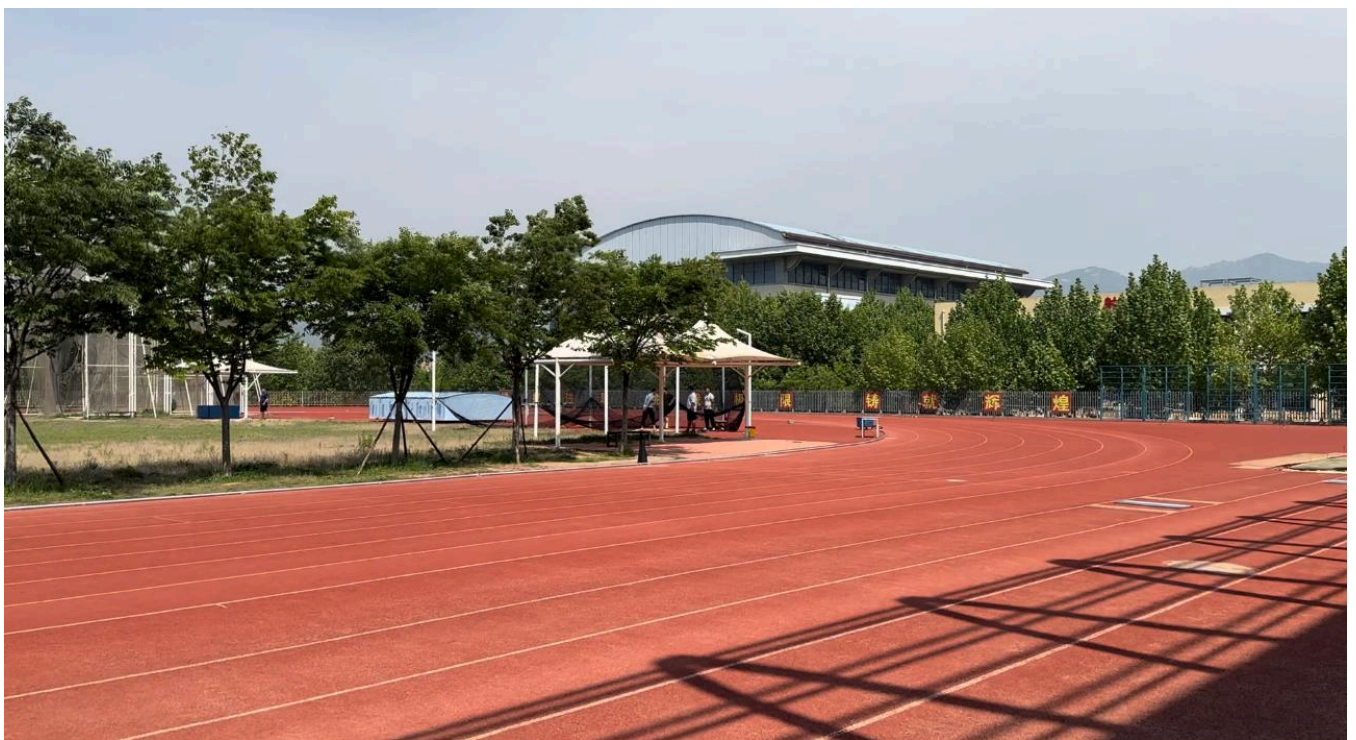
驕陽下蟬鳴中，紅色賽道上是我們青春的汗水。

這時我忽然想起以前那個敢闖敢拚的自己，瞬間懂了：田徑場真是塊奇妙的地方，既長得出勝利，也生得出失敗。每個腳印都藏着兩種可能——要麼是領獎台的光榮，要麼是退場