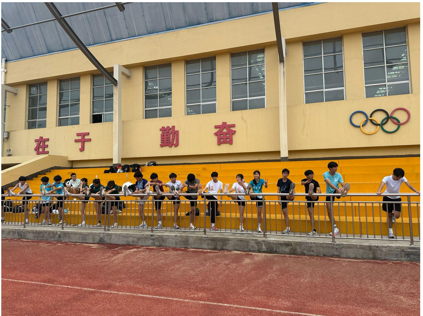
跑道邊，全力備戰，搏盡無悔。