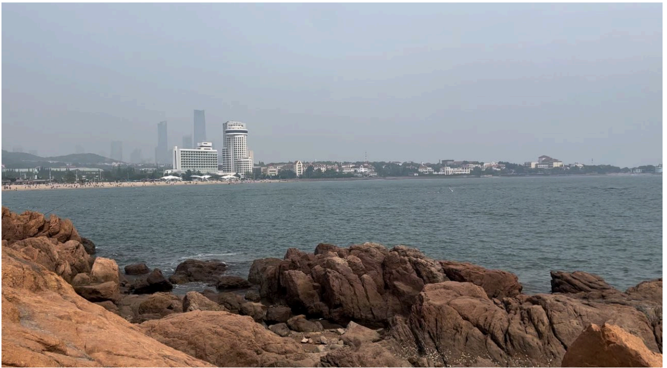
青島海岸的海、礁、城交融之美。